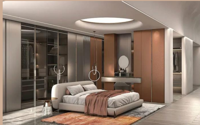
HỆ THỐNG TỦ KỆ ĐỒNG BỘ