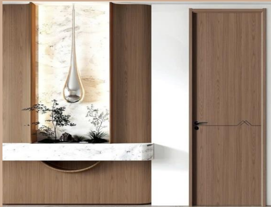
HỆ THỐNG CỬA NGĂN PHÒNG