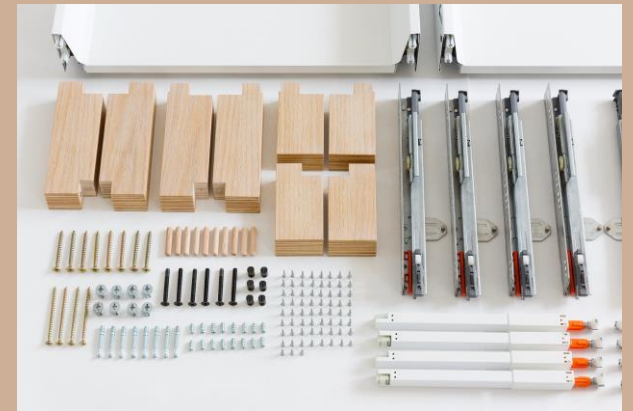
HỆ THỐNG PHỤ KIỆN CAO CẤP